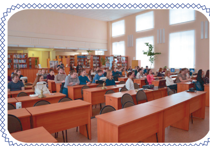
Все в читальный зал! (стр. 5)