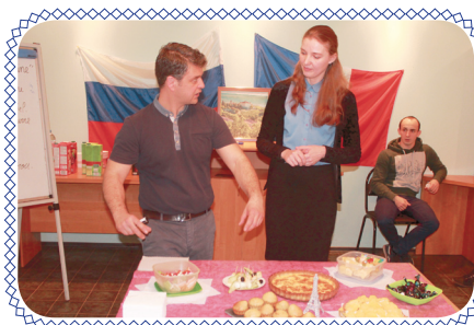
Мир, дружба, ИГЭУ! (стр. 6-7)