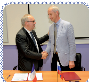
Ректор ENSMM в ИГЭУ (стр. 4)