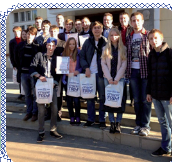
Триумф наших знатоков (стр. 10)