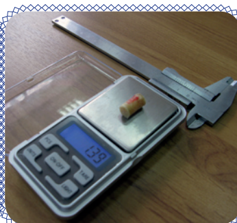
Проверка на прочность (стр. 6 - 7)