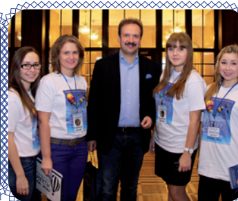
Школа Мечты (стр. 10)