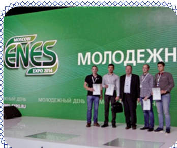
И снова – лучшие! (стр. 3)