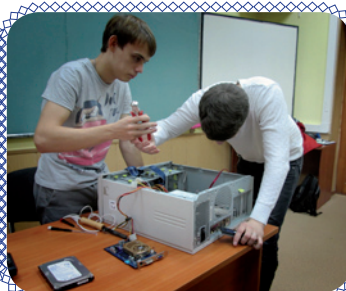
С IT на ты! (стр. 5)