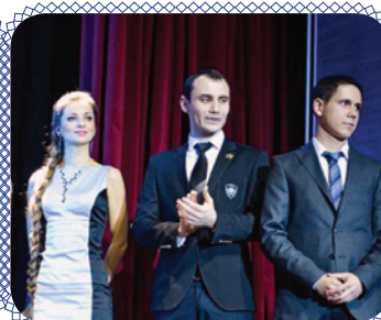
Умница России (стр. 7)