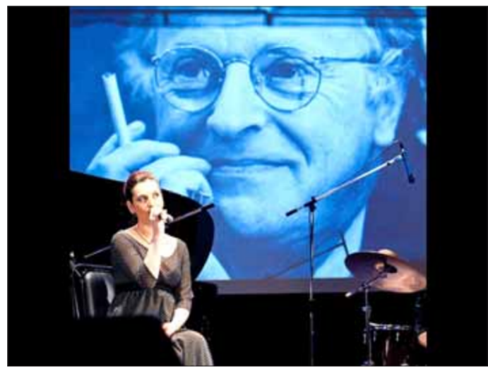
Музыкально-поэтический перформанс Санкт-Петербургского театра Vertump «Иосиф Бродский. Пиллигрим»