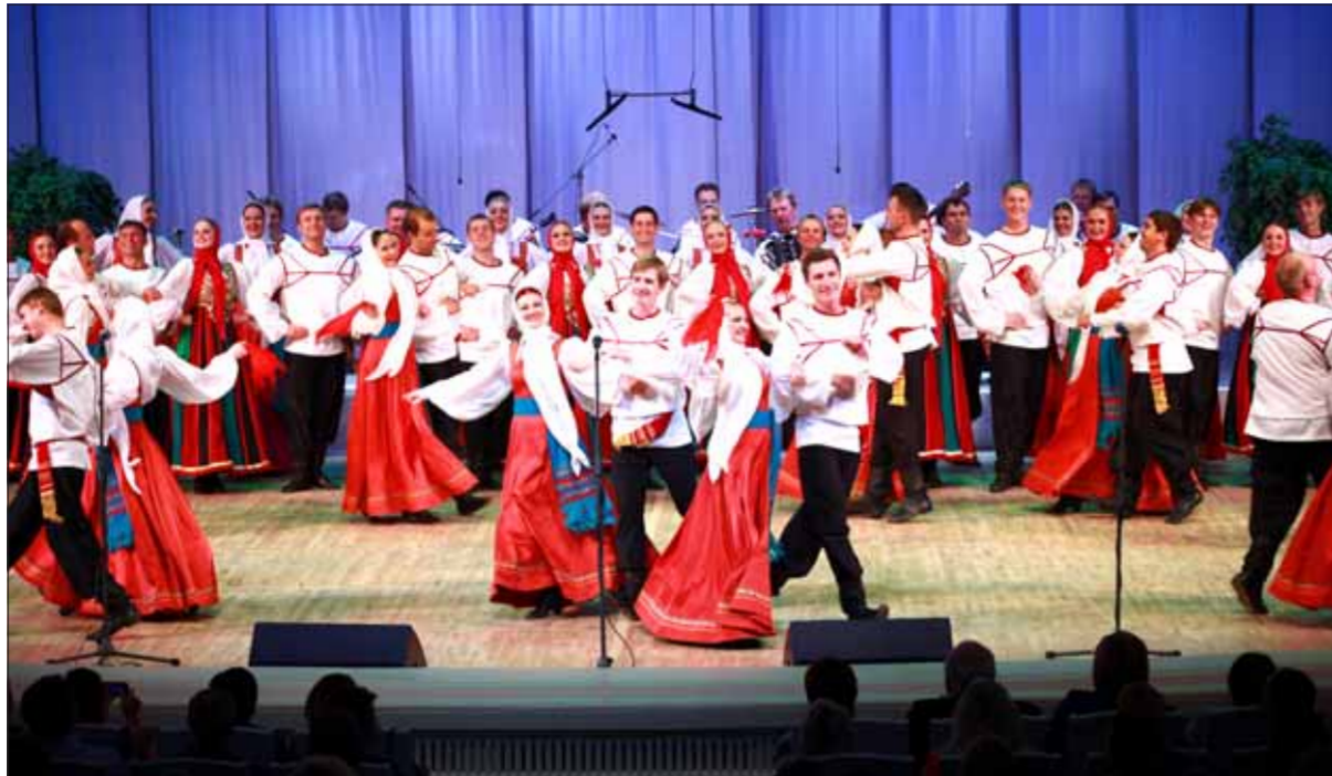
Государственный академический русский народный хор имени М.Е. Пятницкого.

О легендарном хоре сняты художественные и документальные фильмы, изданы книги. Сегодня прославленный коллектив является постоянным участником всех праздничных мероприятий и концертов государственного значения и представляет нашу страну на самом высоком уровне в рамках встреч глав государств, Дней культуры России за рубежом. Хор по праву носит звание «Национальное достояние России». Сейчас средний возраст артистов хора - 19 лет, среди них 48 лауреатов регио-