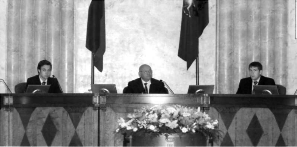
Дублеры вместе с мэром Москвы Ю.М. Лужковым проводят заседание правительства

мышленной палаты Леонид Говоров призвал присутствующих с осторожностью отнестись к созданию СРО и тщательно продумать все нормативно-правовые аспекты идеи. Мэр Москвы Юрий Лужков предложил в порядке эксперимента «отдать на растерзание молодежи» 20-30 проблемных структур имущественного комплекса города - чтобы бригады молодых специалистов попробовали помочь в выводе предприятий из кризисного состояния.