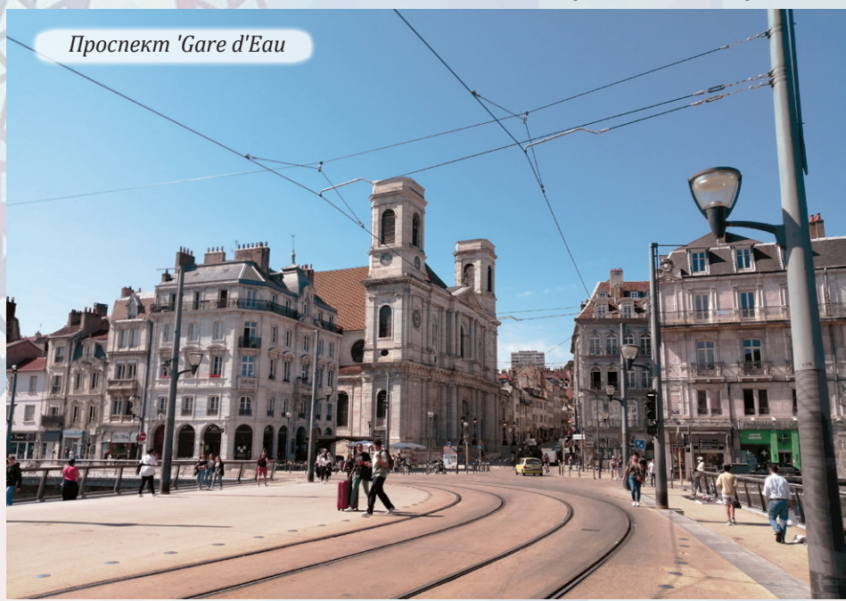
Проспект 'Gare d'Eau'